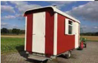
KUNstmobil Hausmannsplatz | Wipperfürth